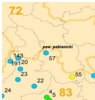
Punkty pomiarowe stanu JCWPd w 2018 r. zlokalizowane na terenie Powiatu Pabianickiego

Klasyfikacja JCWPd-83 w 2018 r. w ppk. w Dłutowie