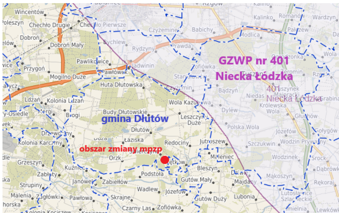
Położenie obszaru zmiany mpzp względem GZWP

Obszar zmiany mpzp położony jest poza zasięgiem GZWP nr 401 Niecka Łódzka.