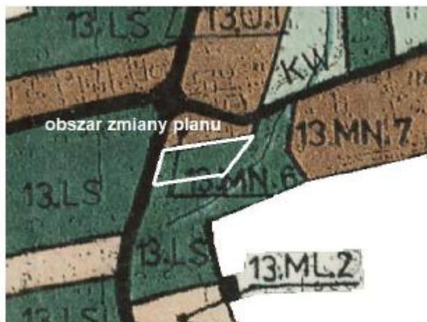
Obszar mpzp na tle Miejscowego planu zagospodarowania przestrzennego Gminy Dłutów z 2004 r.

W aktualnie obowiązującym planie zagospodarowania przestrzennego teren objęty zmianą planu przeznaczony jest na las (zgodnie z ewidencją gruntów), oznaczony na rysunku planu symbolem LS.