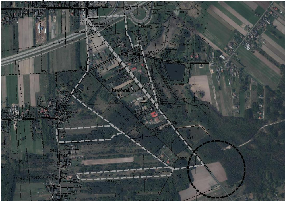
Rysunek 2. Granica opracowania

Autor: Karolina Reliszka, opracowano na podstawie Uchwały Nr XXXIV/171/06 z dnia 27 kwietnia 2006 r. w sprawie przyjęcia statutów sołectw Gminy Dłutów