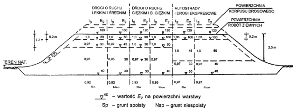
Rys. 1. Wartości wymagane w nasypach: wskaźnika zagęszczenia I_s i wtórnego modułu odkształcenia E_2 , w [MPa], wg [1].

Jako zastępcze kryterium oceny wymaganego zagęszczenia gruntów dla których trudne jest określenie wskaźnika zagęszczenia I_s , przyjmuje się wartość wskaźnika odkształcenia I_0 , wyznaczanego jak określono w punkcie 1.4.3.