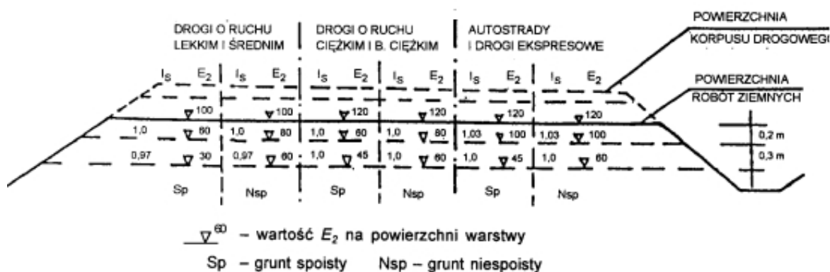
Rys. 1. Wartości wymagane w podłożu wykopów: wskaźnika zagęszczenia I_s i wtórnego modułu odkształcenia E_2 [1].

Wykonawca powinien skontrolować wskaźnik zagęszczenia gruntów rodzimych, zalegających w strefie podłoża nasypu, do głębokości 0,5m od powierzchni terenu. Jeżeli wartość wskaźnika zagęszczenia I_s jest mniejsza niż określona w tablicy 2, Wykonawca powinien dogłębić podłoże tak, aby powyższe wymaganie zostało spełnione. Jeżeli wartości wskaźnika zagęszczenia I_s określone w tablicy 1 i na rys 1. nie mogą być osiągnięte przez bezpośrednie zagęszczanie podłoża, to należy podjąć środki w celu ulepszenia gruntu podłoża, umożliwiające uzyskanie wymaganych wartości wskaźnika zagęszczenia I_s .