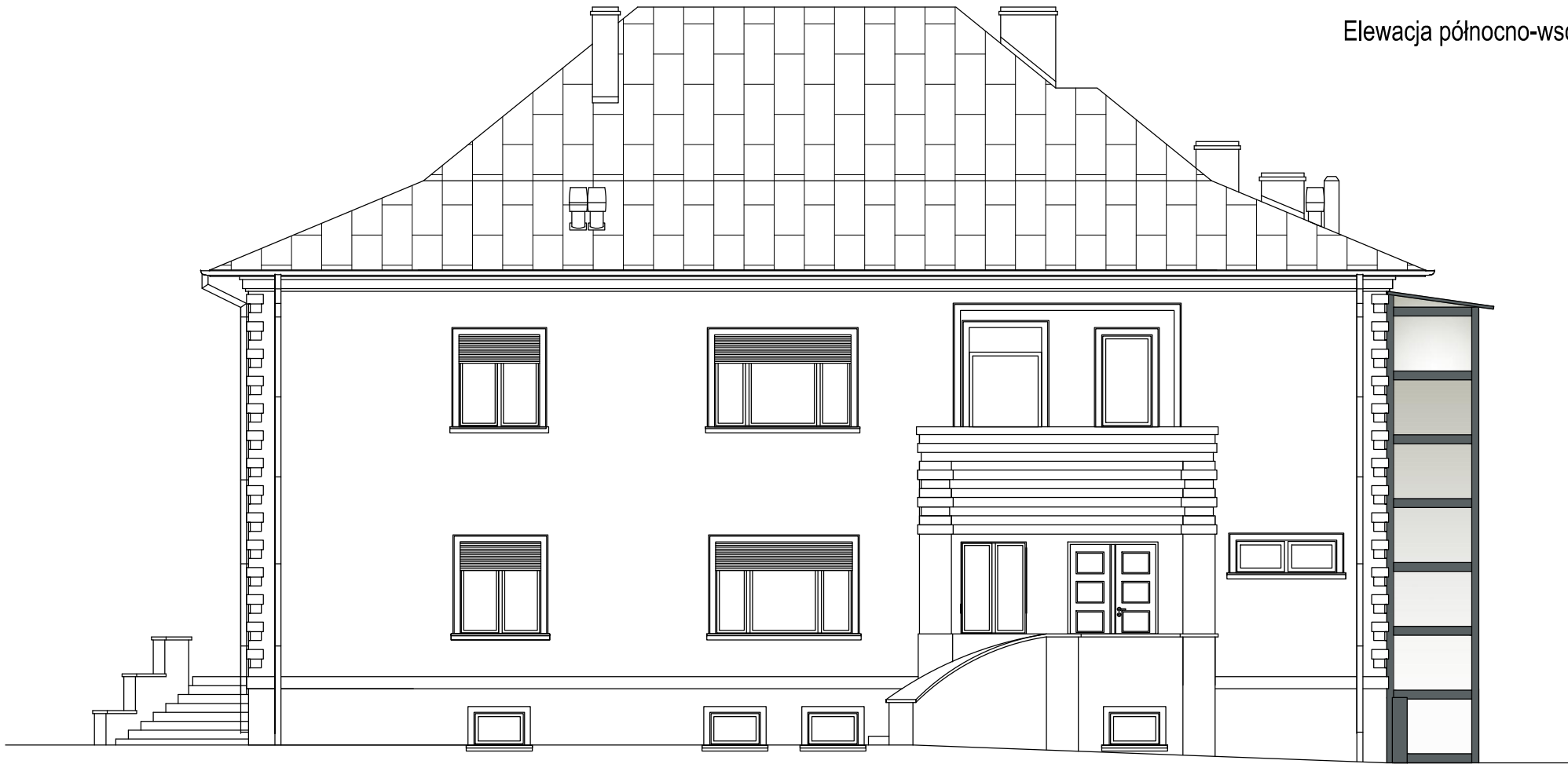
Elewacja północno-wschodnia (frontowa)