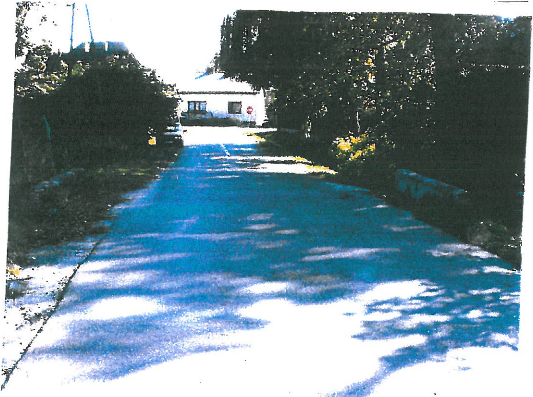
Widok z góry od strony północnej

ZA ZGODNOŚĆ Z ORYGINAŁEM inż. BOGDAN PRZYBYCIEN upr. projektant: inż. bud. w specj. konstr. - inż. dróg § 5 ust. 1, § 7 § 13 ust. 1 pkt 3 b 97-400 Bełchatów os. Dolnośląskie 341 m.135, tel.044 632 13 16