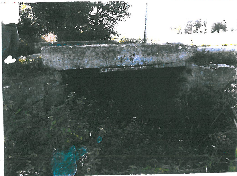
Widok od strony górnej wody.

STAROSTWO POWIATOWE w PABIANICACH Wydział Architektury i Budownictwa UL. PIŁSUDSKIEGO 2 95-200 PABIANICE t. c. 42 22 54 000, t./fax 42 22 54 0 47