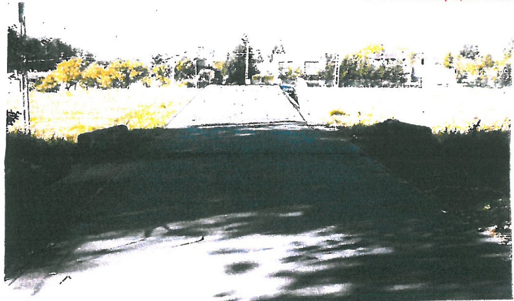
Widok z góry od strony południowej

STAROSTWO POWIATOWE PABIANICE (5) Wydział Architektury i Budownictwa UL. PIŁSUDSKIEGO 2 95-200 PABIANICE t. c. 42 22 54 000, t./fax 42 22 54 047