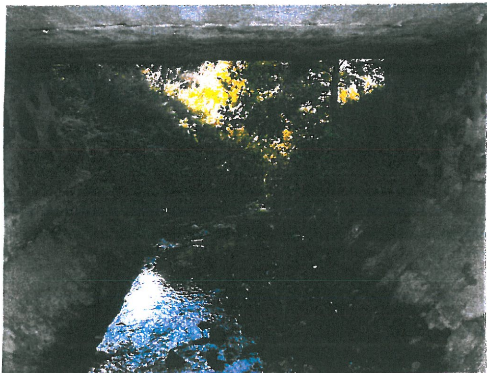
Koryto rzeki pod obiektem.

ZA ZGODNOŚĆ Z ORYGINAŁEM inż. BOGDAN PRZYBYCIEN upr. projektant i kier. bud. w specj. konstr. - inż. dróg § 5 ust. 1, § 7 i § 13 ust. 1 pkt 3 b 97-400 Belchatów os. Dolnośląskie 341 m.135, tel.044 632 13 76