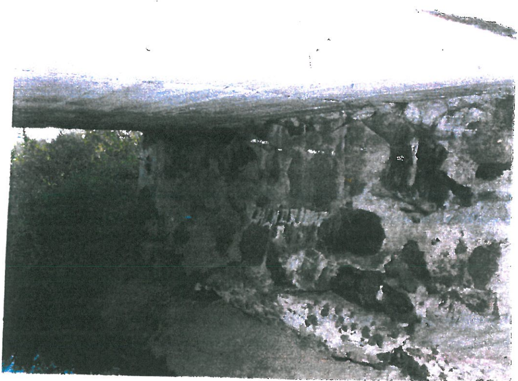
Podpora od strony południowej

ZA ZGODNOŚĆ I ORYGINAŁEM inż. BOGDAN PRZYBYCIEN upr. projektant: 1147/tud. w specj. konstr. - inż. dróg s. 61 ust. 1, § 7 i § 13 ust. 1 pkt 3 b 97-400 Bełchatów os. Dolnośląskie 341 m.135, tel.044 632 13 16